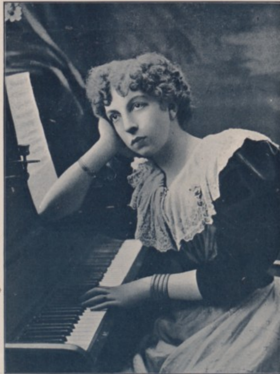
D'APRÈS UN PORTRAIT DE H.-S. MENDELSSOHN