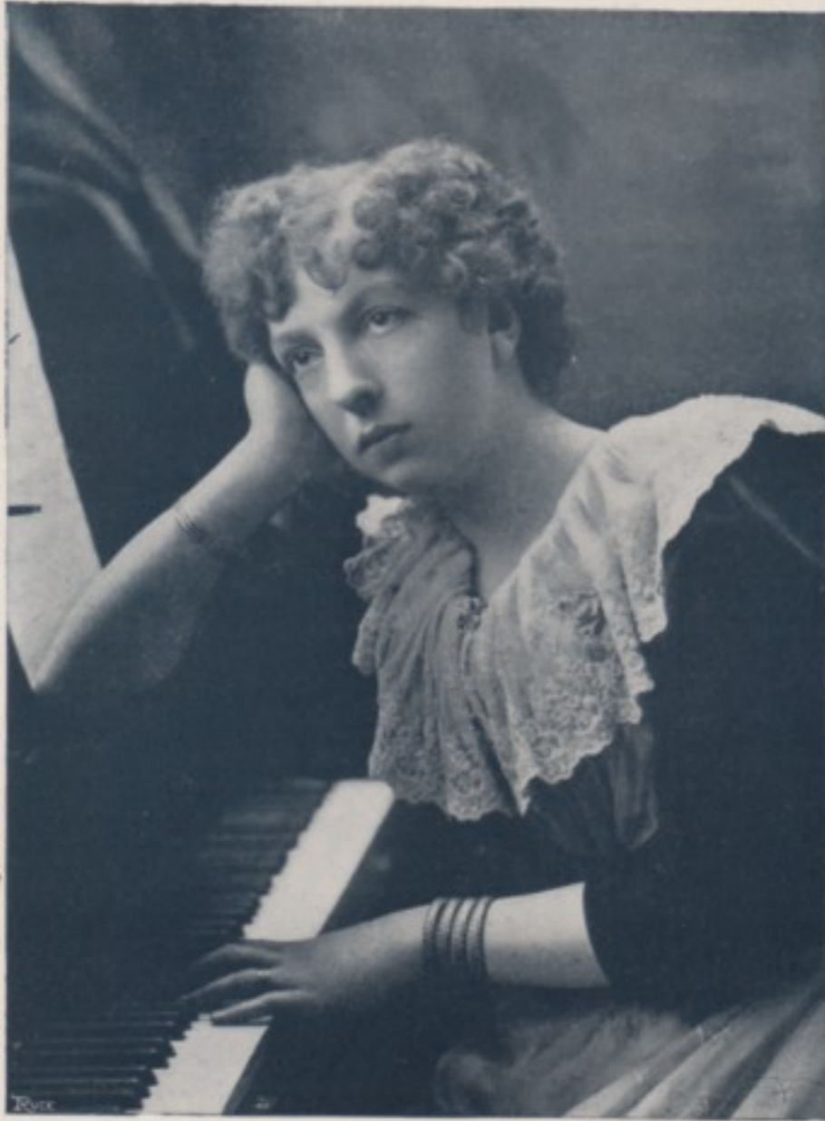
D'APRÈS UN PORTRAIT DE H.-S. MENDELSSOHN