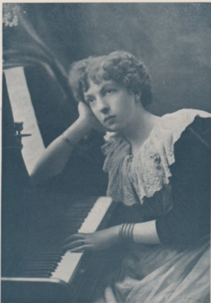
D'APRES UN PORTRAIT DE H. S. MENDELSSOHN