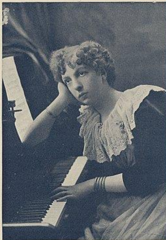
D'APRÈS UN PORTRAIT DE H.-S. MENDELSSOHN