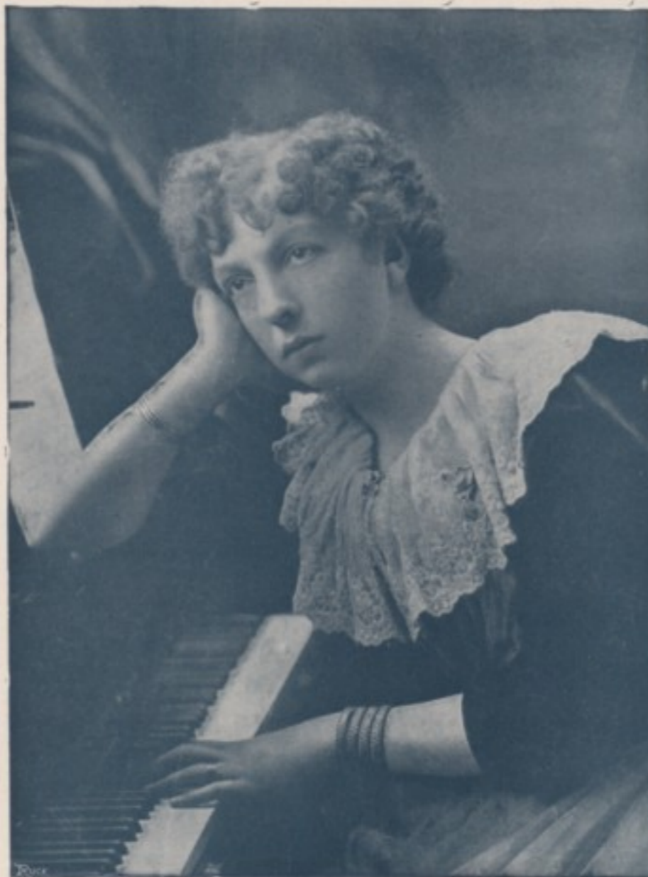
D'APRÈS UN PORTRAIT DE H.-S. MENDELSSOHN