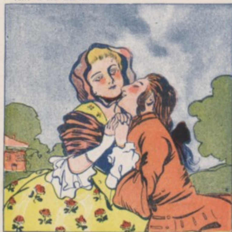
VII. — MANON ET DES GRIEUX

Chacun sait que le Masque de Fer jouait du violoncelle. Son morceau préféré était Nuages Roses , de Rodolphe Berger. — Si le Roi-Soleil m'a précipité dans les sombres cachots de Pignerol, disait-il à son geôlier, j'ai du moins le Roi de la Valse pour charmer mes loisirs.