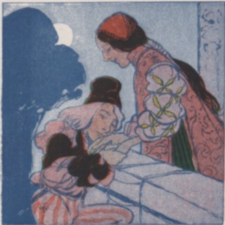
V. — ROMÉO ET JULIETTE

— Pourquoi ce visage morose ? demandait la reine d'Égypte au triumvir romain. — Ne suis-je pas Loin du Pays , répondit le fameux guerrier. Et Cléopâtre, qui connaissait ses classiques, susurra le leit-motiv cette célèbre valse lente.