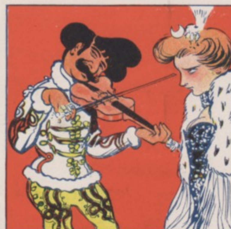
IX. — LE TZIGANE ET LA PRINCESSE