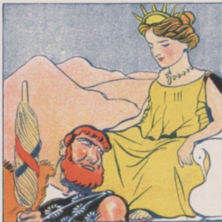
II. — HERCULE ET OMPHALE

ORPHÉE. — Si nous écrivions à Glück pour lui demander d'ajouter une valse lente à sa partition. EURYDICE. — Inutile, mon cher, nous allons tout simplement remplacer le chœur des Damnés par la Valse des Baisers , de Louis Ganne, et tu m'en diras des nouvelles.