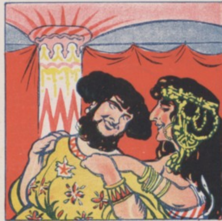
III. — SAMSON ET DALILA