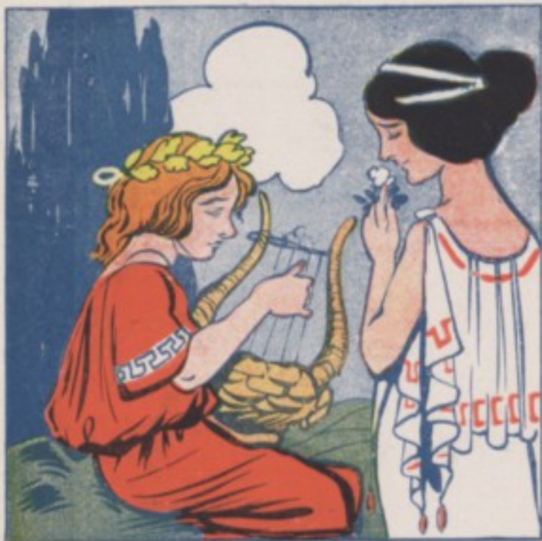
I. — ORPHÉE ET EURYDICE

ORPHÉE. — Si nous écrivions à Glück pour lui demander d'ajouter une valse lente à sa partition. EURYDICE. — Inutile, mon cher, nous allons tout simplement remplacer le chœur des Damnés par la Valse des Baisers , de Louis Ganne, et tu m'en diras des nouvelles.