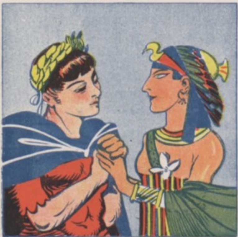
IV. — ANTOINE ET CLÉOPÂTRE