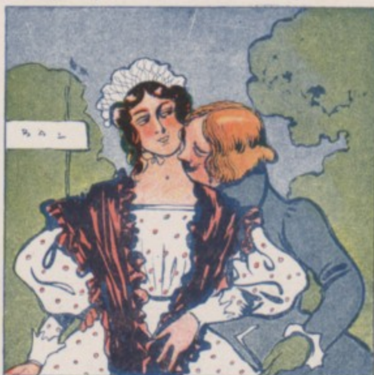
VIII. — RODOLPHE ET MIMI