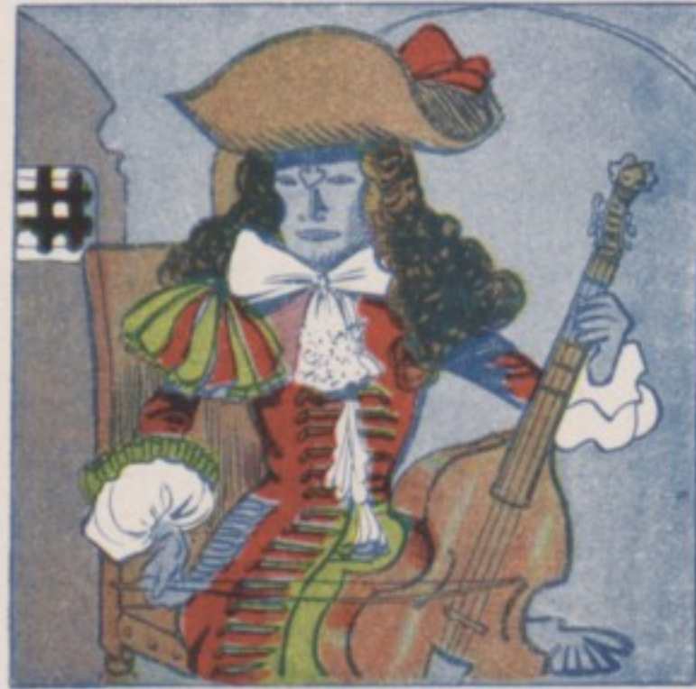
VI. — LE MASQUE DE FER