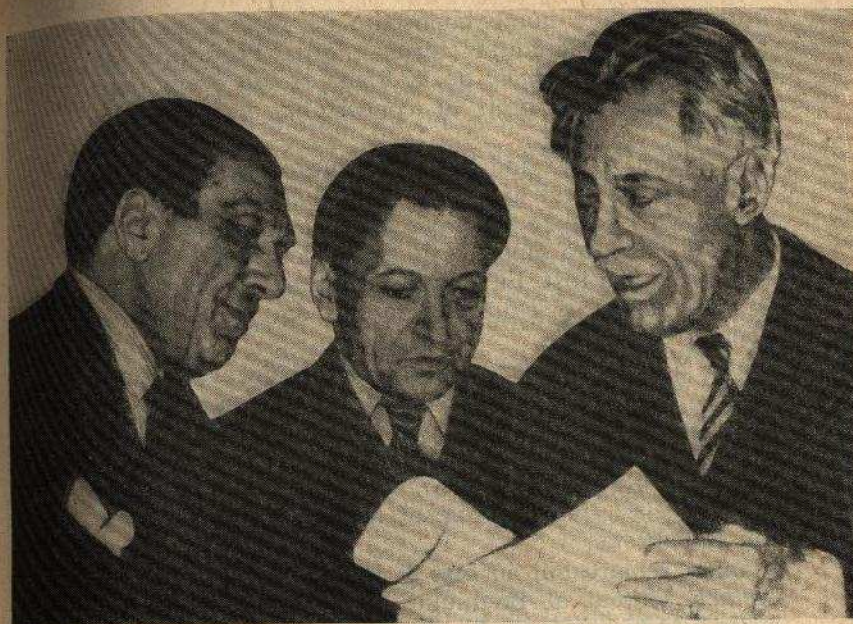
Fritz Kreisler împreună cu G. Enescu și Jacques Thibaud

Marele Laënnec studia cu pasiune flautul, în care găsea un bun prieten în orele de odihnă și destindere. Duchenne de Boulogne , fondatorul electrofiziologiei, a fost un remarcabil interpret al viorii. Printre violoniști